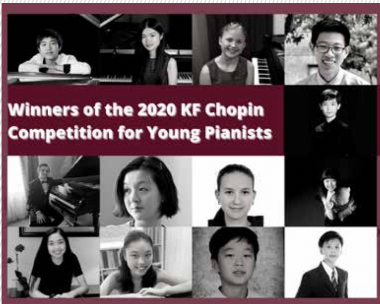
Winners of the 2020 KF Chopin Competition for Young Pianists

FOR YOUNG PIANISTS OCTOBER 9-11, 2020 WASHINGTON D.C.